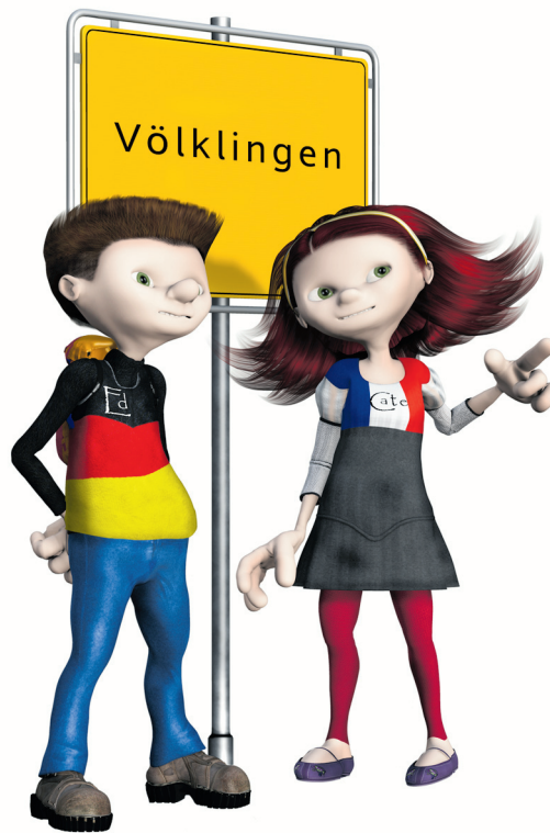
Ed u. Cate, die Maskottchen der jungen VHS gehen mit auf grenzübergreifende Besichtigungstour.