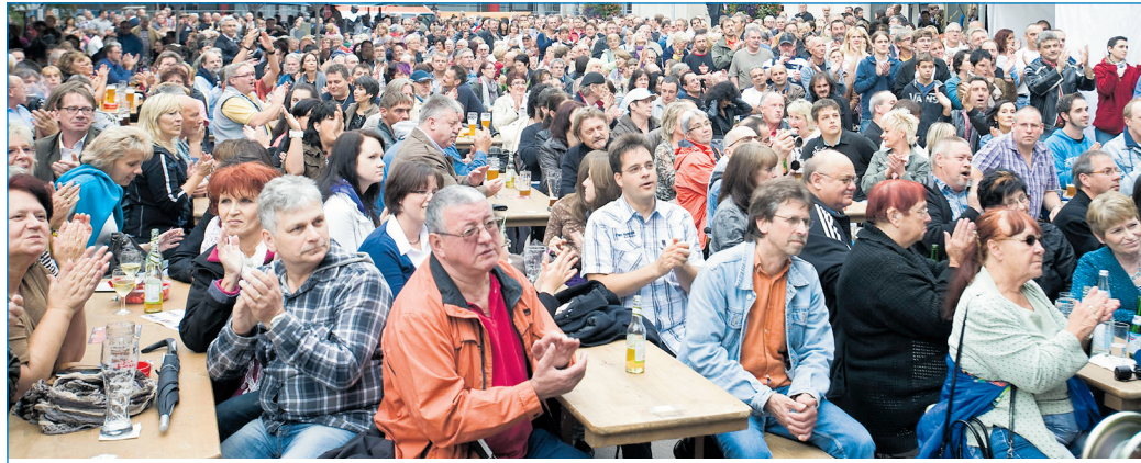
Beliebter Treffpunkt für Musikfreunde: die Völklinger City-Open-Airs